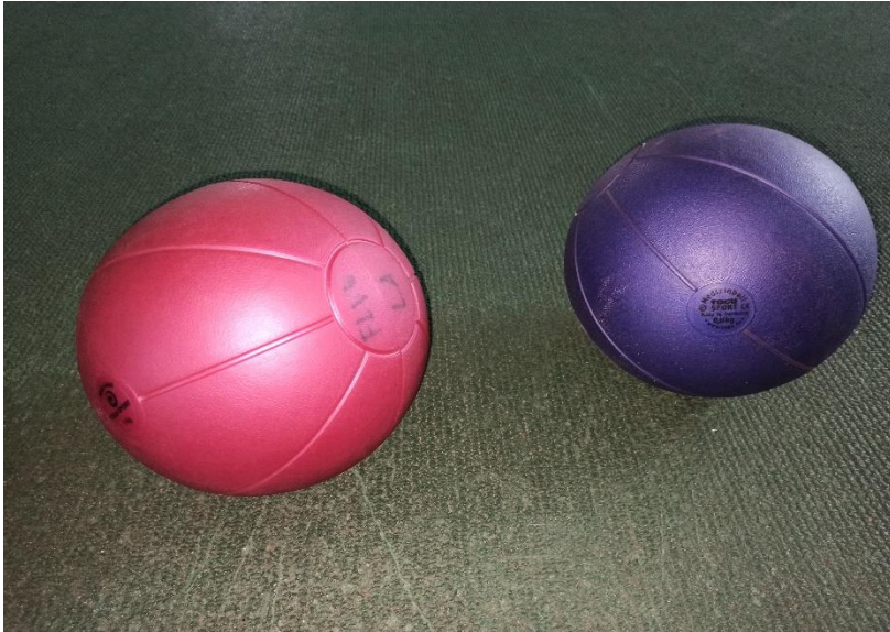
Medizinbälle aus Kunststoff (Beispiel 1,0kg und 0,8kg)