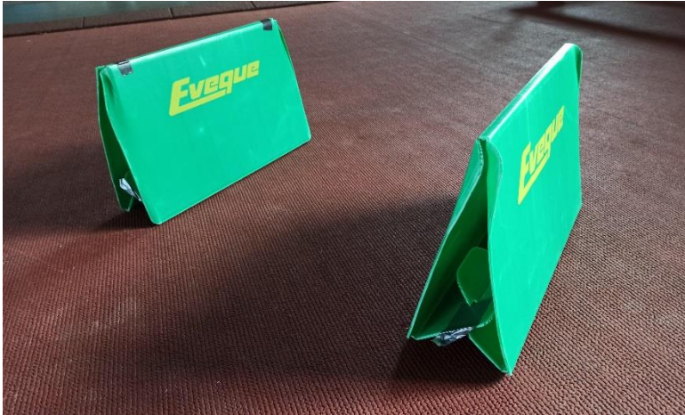
Hindernisse aus Kunststoff